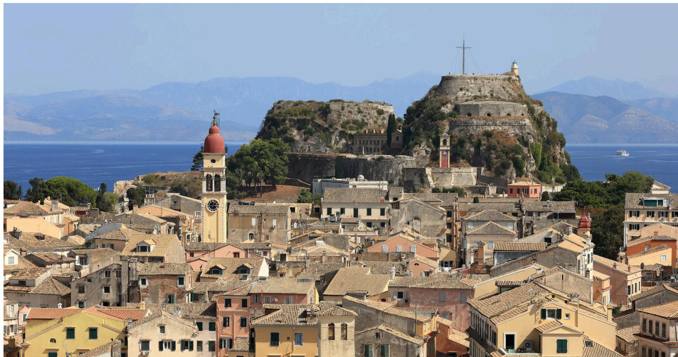
Stara Forteca w mieście Korfu