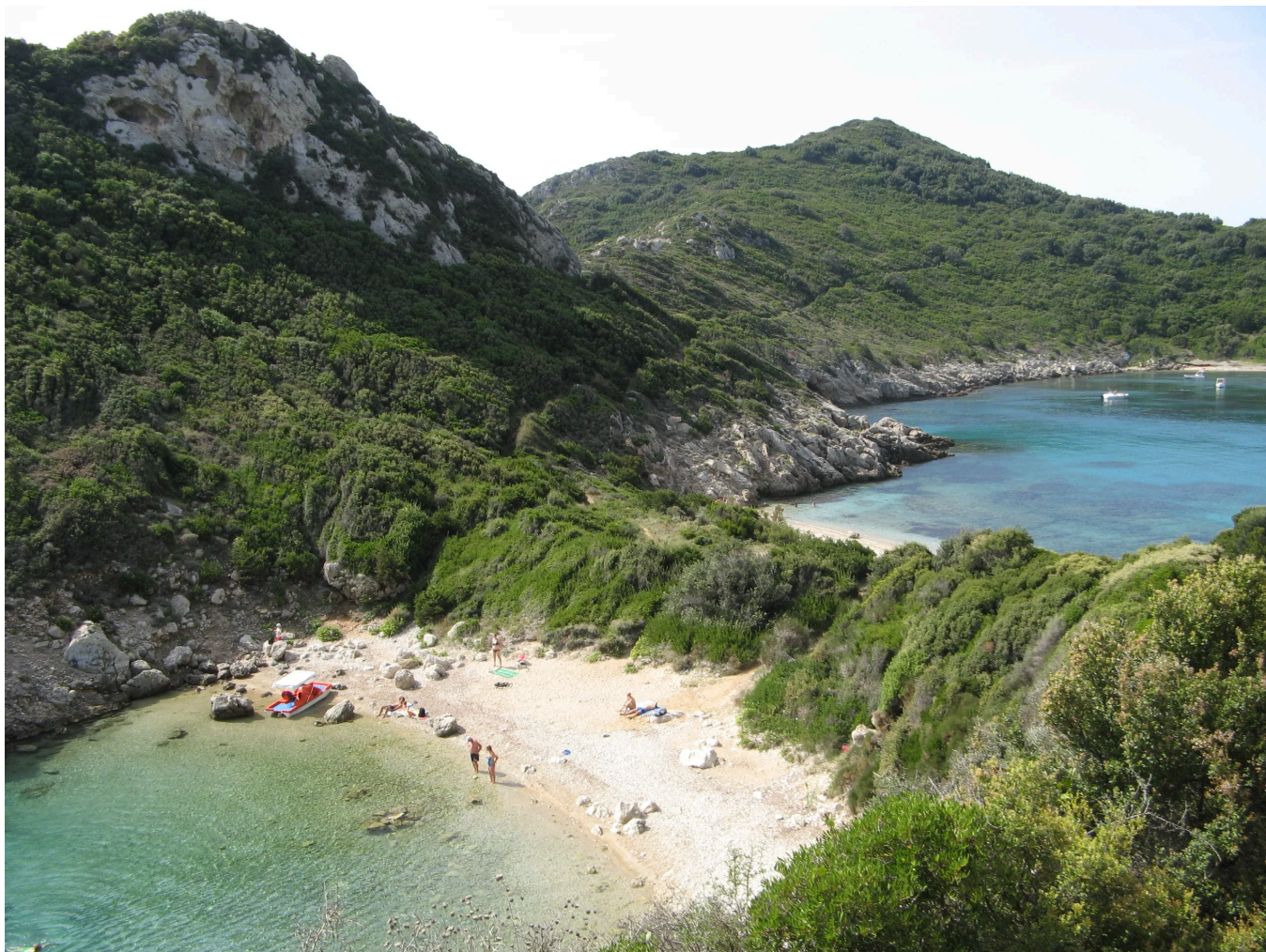
Porto Timoni - podwójna plaża